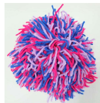
「コミュニティーボール」

対話を通して，「親切，思いやり」を「 多面的・多角的にとらえる 」という「 見方・考え方 」をかせて，これまで考えていた「親切，思いやり」の考え方が広がったり深まったりする(協働性)対話の後には，各グループでどのように話が進んでいったか，振り返りをする。それぞれが，どのような視点で話し合いをしたか知ることができるのである。ほかのグループで話し合ったことを聴いて，子どもは「親切，思いやり」について「 多面的・多角的にとらえる 」という「 見方・考え方 」を働かせて，異なる考え方や感じ方をけ入れ，よりよい解を考える(② 思考力・判断力・表現力 )。