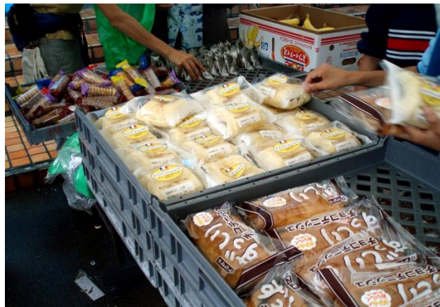
▲支給されたパン類