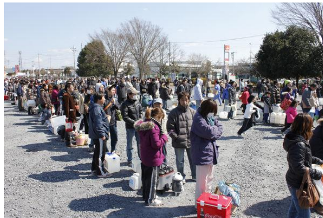
▲水を補給しようと並ぶ人々