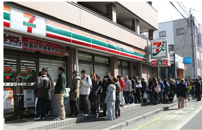
▲コンビニに食料を求めて並ぶ人々