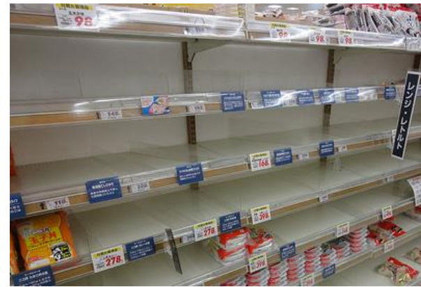
▲食料品がほとんど置かれていないコンビニ