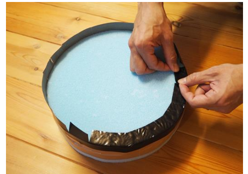
③挟んだ隙間と、スタイロフォームの角の円周をガムテープで巻いて留める。