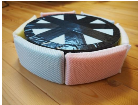
⑤周りに両面テープを貼り、食器用スポンジを6個貼り付ける。