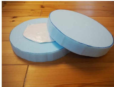
②100g の紙粘土をビニール袋に入れ、平たくつぶして2枚のスタイロフォームで挟む。