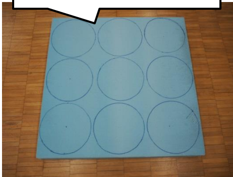
①スタイロフォームを電動糸のこぎりで直径 28cm の円形に切る。