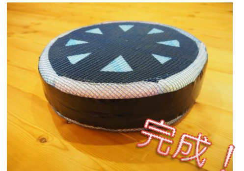
⑧丸めた部分をぐるっと布ガムテープで巻き、さらに上下の端を少し空けて2回程度巻く。