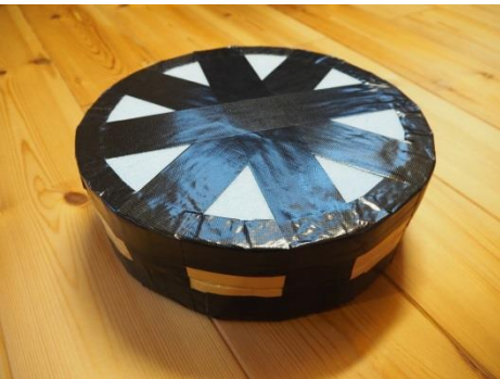
④写真の様にしっかりとガムテープで巻いて留める。